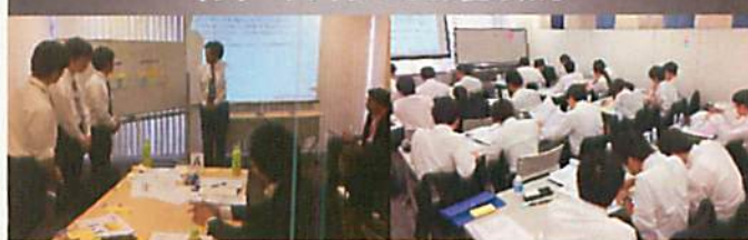
インターンシップ 2019夏の様子