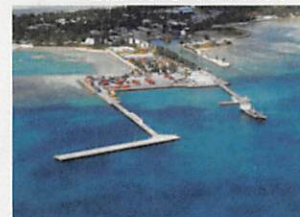
ベジオ港拡張：連絡橋、係留棧橋(キリバス)

交通費 近畿圏内 3,000円 近畿圏外 5,000円 九州、沖縄 10,000円